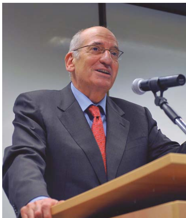
Pascal Couchepin lors de l'inauguration de la Fondation Pierre du Bois pour l'histoire du temps présent, le 8 décembre 2008

Pascal Couchepin illustra son choix en faveur d'une politique de prudence à l'aide de plusieurs exemples. Quelle était la logique suivie par Daladier en 1938 lorsqu'il signa le Traité de Munich? Le Président du Conseil avait-il opté pour la prudence, en se disant que la France n'était pas suffisamment armée pour une confrontation militaire? Mais, dans ce cas, ne devait-il pas tout entreprendre pour améliorer la pré-