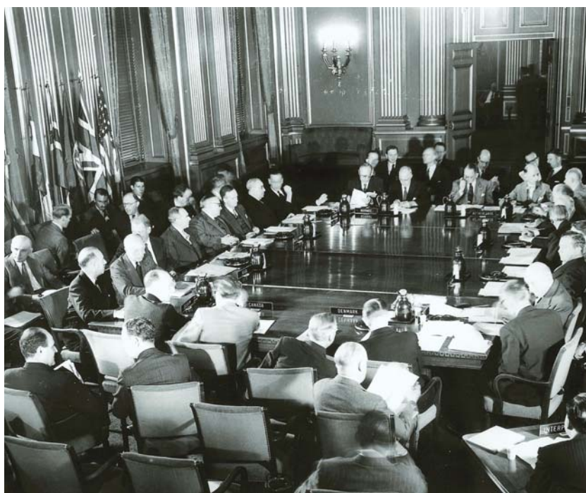
Création de l'OTAN en 1949