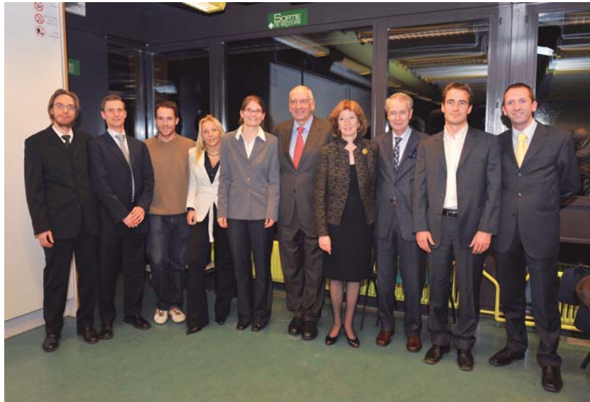
Pascal Couchepin (au centre), Irina du Bois, Philippe Pidoux et le groupe de «chercheurs associés» lors de l'inauguration de la Fondation le 8 décembre 2008

La règle d'or de l'homme politique face à l'actualité – et c'est ainsi que Pascal Couchepin conclut son exposé – est d'accepter les réalités politiques et les hommes tels qu'ils sont et avec les risques qu'ils impliquent. C'était là, selon lui, la base d'une politique de prudence fondée sur une morale de responsabilité. ■